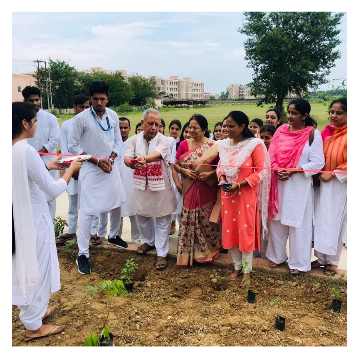
Inauguration of NSS Vatika by Honourable PVC Sir