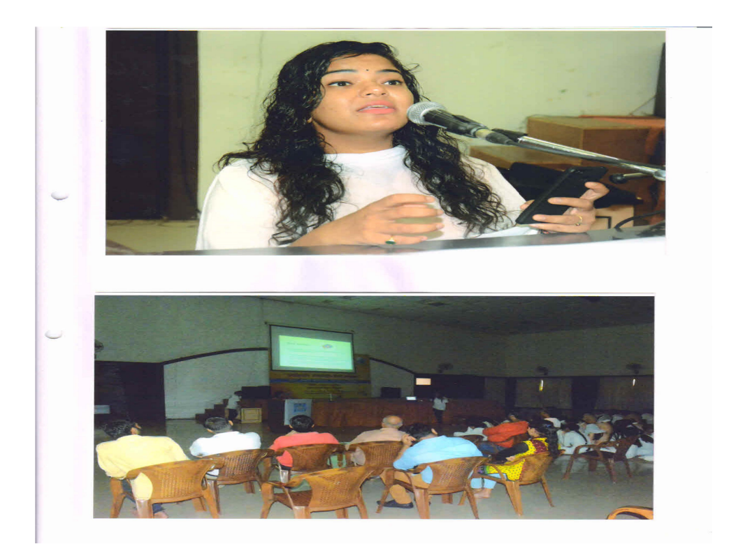
Presentation on Mental Health issues by NSS volunteers