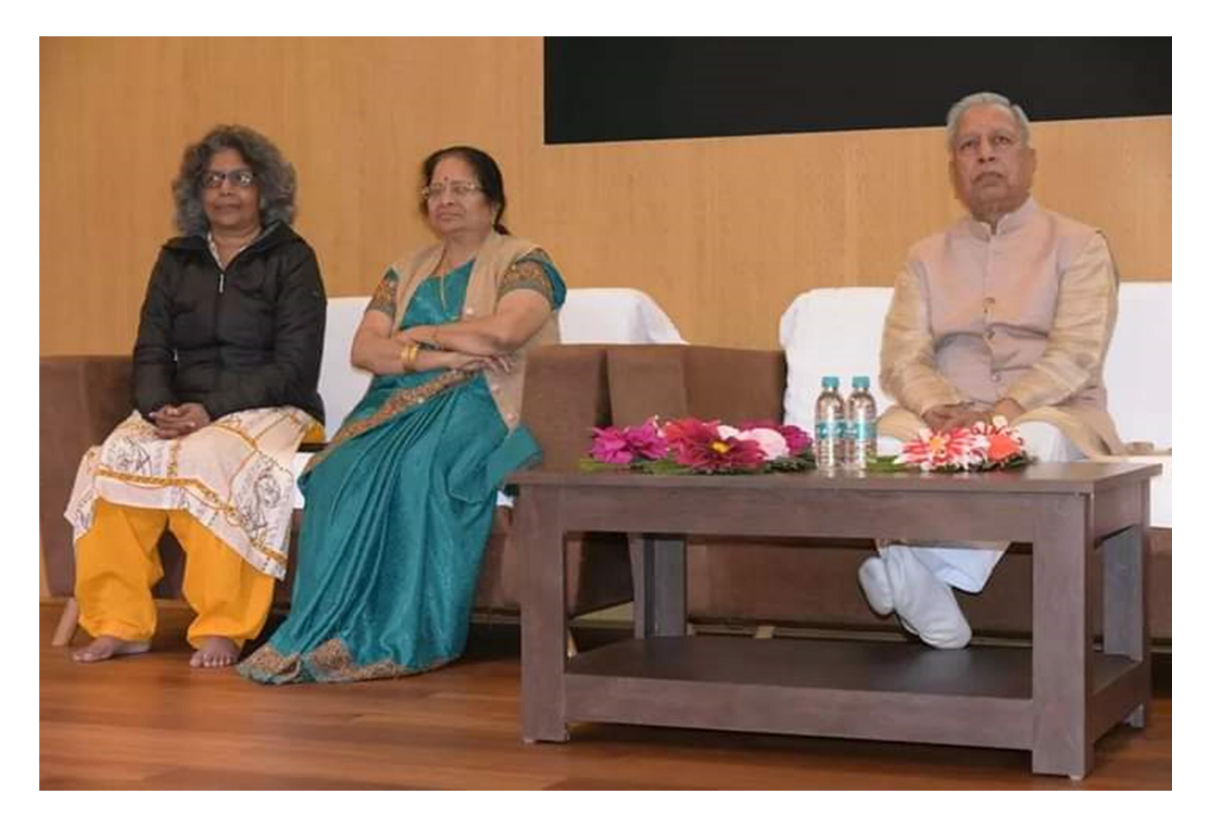
Right- PVC Sir, Left- Dean of Girls Discipline and Middle- Chief Guest (spouse of Honourable PVC sir)