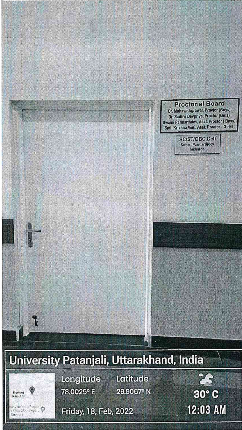
Office of Proctorial board at Administrative block of the university campus