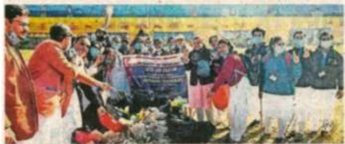
हरिकी पैड़ी क्षेत्र में स्वच्छता अभियान चलाते हुए लोगों की संख्या - 2000