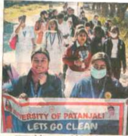
स्वच्छता को लेकर अग्रगण्य डीपी विश्वविद्यालय परंतुपरी विश्वविद्यालय की छात्राएं। . .